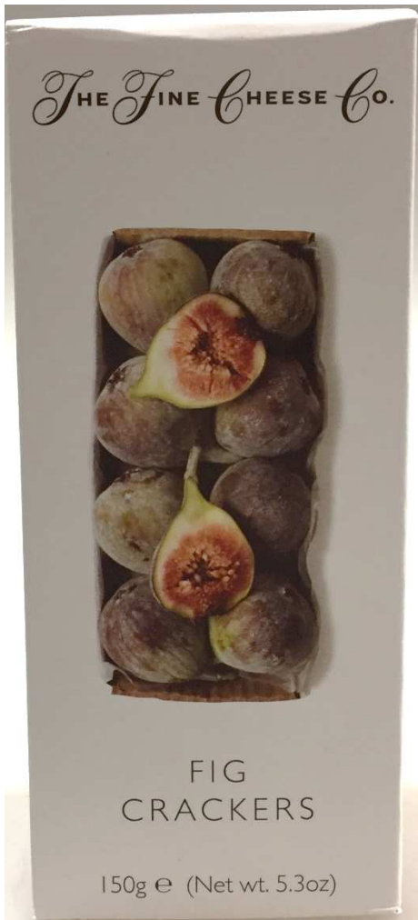
FIG CRACKERS Ingredients: Wheat Flour, Palm / Rapeseed Oils, Branflakes (Wheat, Wheat Bran, Sugar, Malted Barley Extract, Salt), Autolysed Yeast, Whey Powder (Milk), Fig Puree (4%), Salt, Raising Agent (Sodium Bicarbonate), Natural Flavouring. Not suitable for nut allergy sufferers. Best before end: See base.

CRACKERS A LA FIGUE Ingrédients: Farine de Blé, Huile de Palme / de Colza, Flocons de Son (Blé), Son de Blé, Sucre, Extrait d'Orge Malté, Sel), Extraits de Levure, Poudre de Petit-Lait, Purée de Figues (4%), Sel, Poudre à Lever (Bicarbonate de Soude), Arôme Nature. Ne convient pas aux personnes allergiques aux fruits à coques. À consommer de préférence avant fin: Voir emballage.